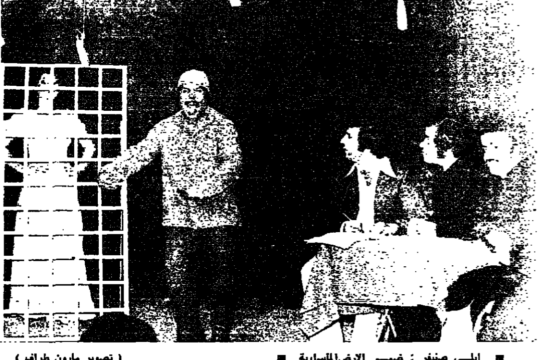
ابلي صنيفر : فصح الارض المسابرة

المؤسسة المالية العامة (مختبر تشعرون وشركاه) تعلن المؤسسة المالية العامة لزيارتها الكرام عن انتقال ملكيتها الى يد ياريا التي تديرها العمليه - شارع ساي الصبح لتعذر إعادة فتحها في بنياية العمارة في الوقت الحاضر - فعلمت ربا ثقتنا الكرام بالانضمام الى المؤسسة على الهاتف: ٣٨٠١٩٧-الأردن: عمود صحت شعرون